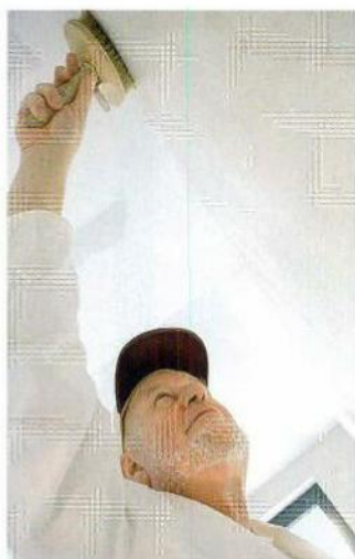
Die Offerten für ein Zimmer lagen bis 1345 Franken auseinander